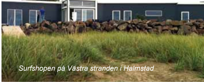
Surfshopen på Västra stranden i Halmstad