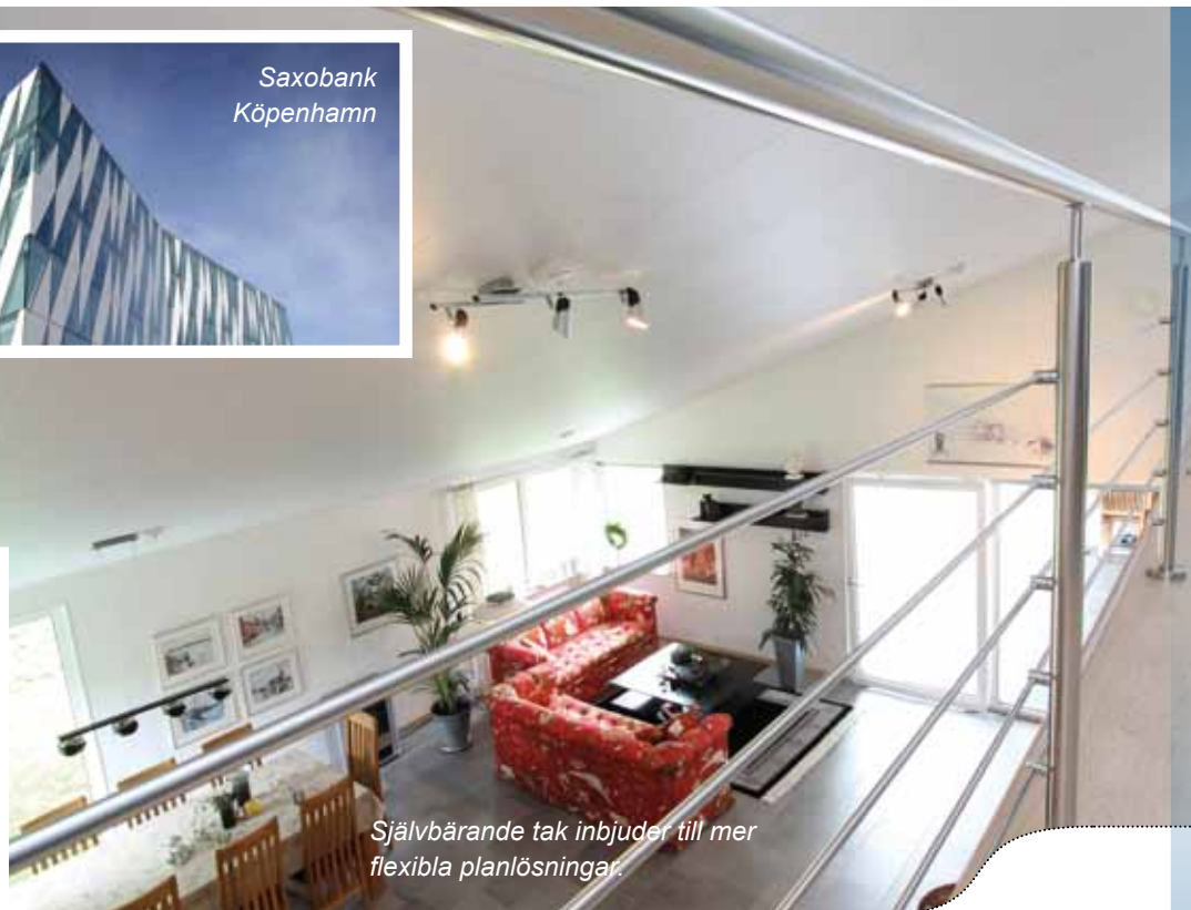
Självbärande tak inbjuder till mer flexibla planlösningar.

Ring eller gå in på hemsidan för mer information.