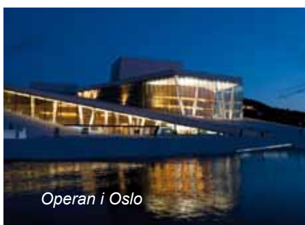
Operan i Oslo