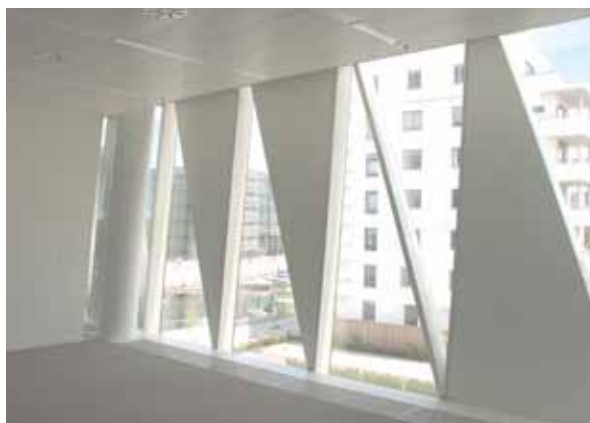
Fasadkassetter med lågt U-värde på Saxobank i Köpenhamn.

Enligt kommande direktiv från EU kommer passivhusen att vara standard efter 2020. Att leverera högkvalitativa byggnader med fokus på miljö och energi visar på ett etiskt ställningstagande som i framtiden kommer att vara en viktig konkurrensfördel för leverantören. Efterfrågan på lågenergi/ passivhus ökar stadigt hos konsumenten och de som tidigt väljer att leverera den här tekniken kommer att ligga bra till på marknaden i framtiden.